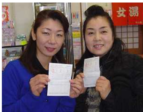
スタンプラリーチャレンジカード を手にする田園キッチン来店者

今年も恒例のスタンプラリー の季節がやってきた。 熊本市と健康くまもと二十一 推進市民会議の共催で実施する もの。