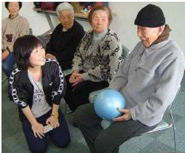
利用者に笑顔で語りかける実習生

ウエルネススクエア和楽で、明るい笑顔で実習に取り組む国立病院機構 熊本医療センター附属看護学校の学生さん。利用者は、実習生との会話が楽しみの一つになってきた。